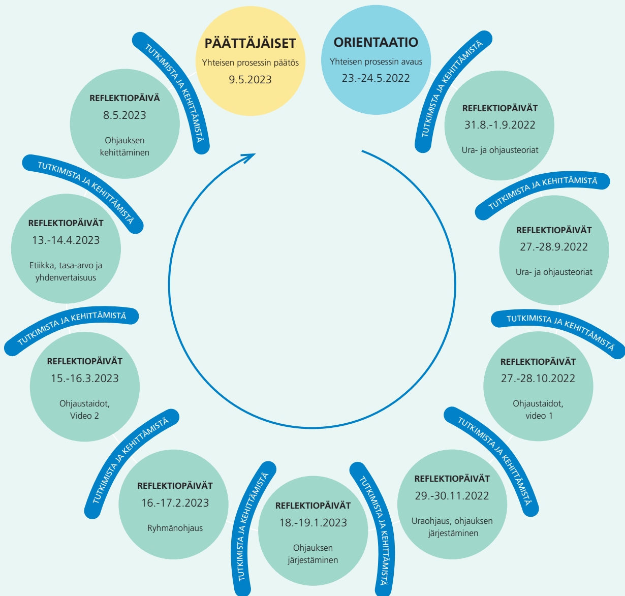
Kuvio 2. Reflektiopäivät opinto-ohjaajakoulutuksessa.